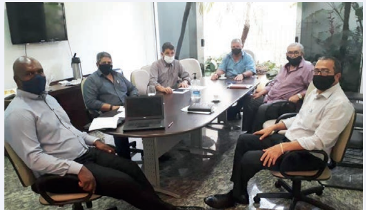
Acordo do setor de cargas foi fechado durante reunião em Uberlândia